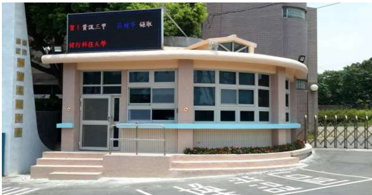
【警衛室外觀整修及色彩美化】（配合校門整體改善）