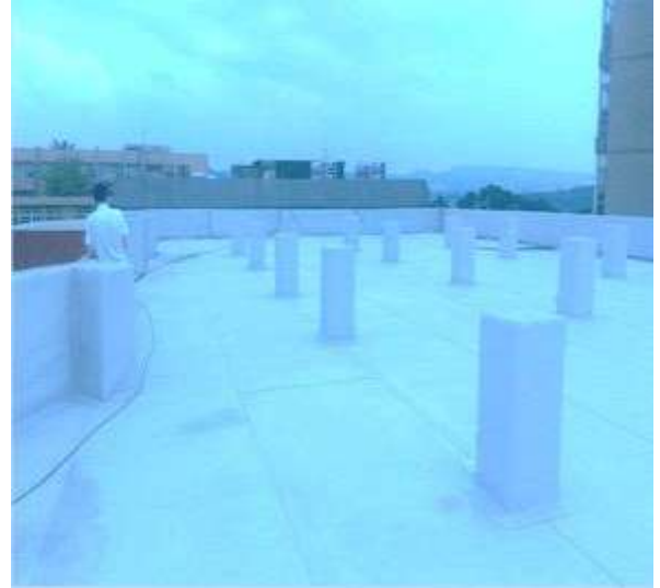
【生科大樓屋頂防水隔熱】