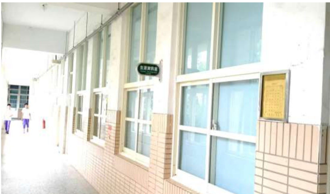
↑【輔導專科教室-已更換窗量及窗戶(尚未情境粉刷)】