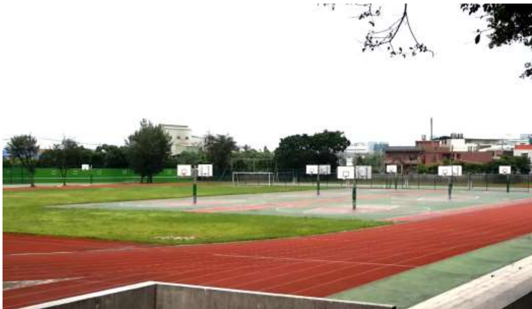
↑【暑假進行，操場球場整修工程】(圖為整修前)