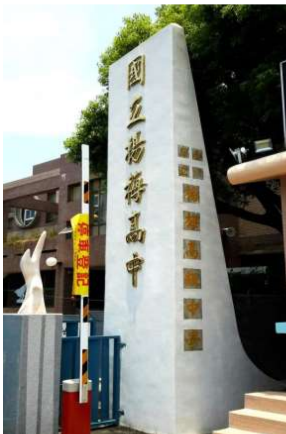
【校門長柱整修更新校牌字】