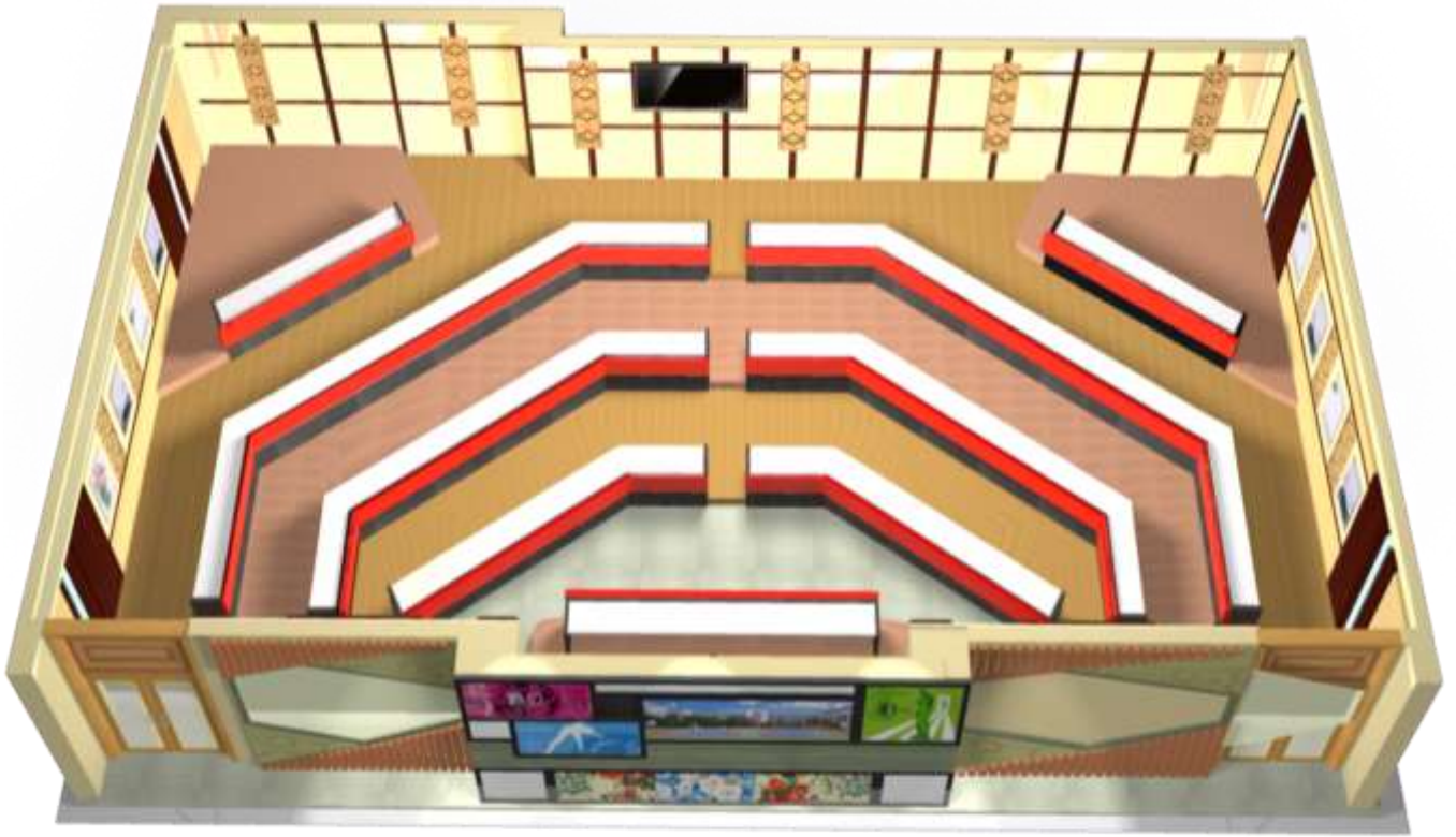
↑【會議室全區上視圖】(僅為示意圖)