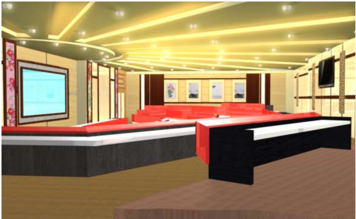
↑【會議室側面圖】(僅為示意圖)