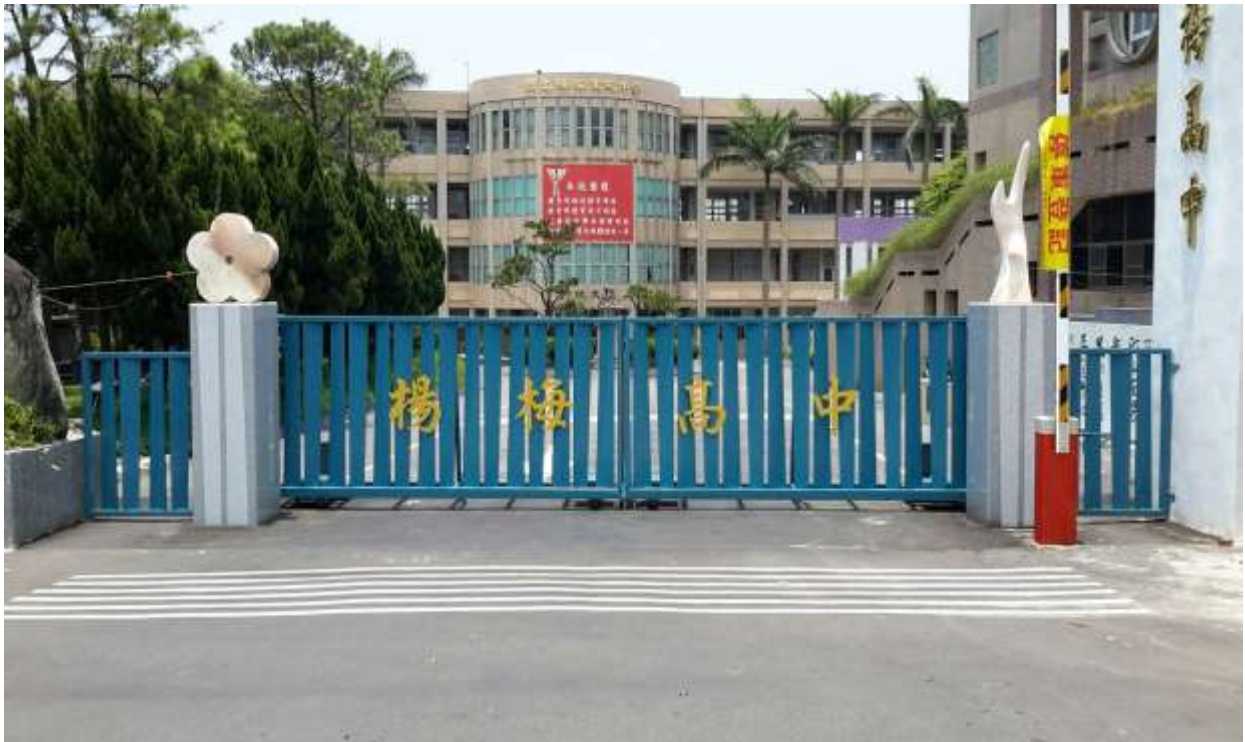
【富有藝術氣息的新校門】