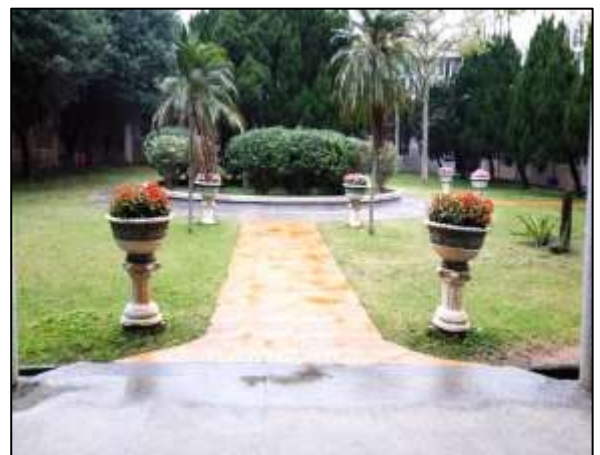
【增加酒杯及種植草花】