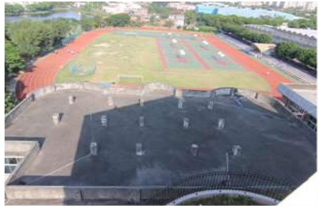
【生科大樓屋頂防水隔熱】