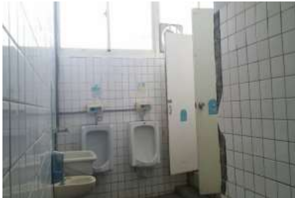
【工科大樓3F老舊廁所】

105年急迫性需求計畫—規劃整修工科大樓3F老舊廁所及生科大樓屋頂防水隔熱，目前該計畫國教署已通過審核。