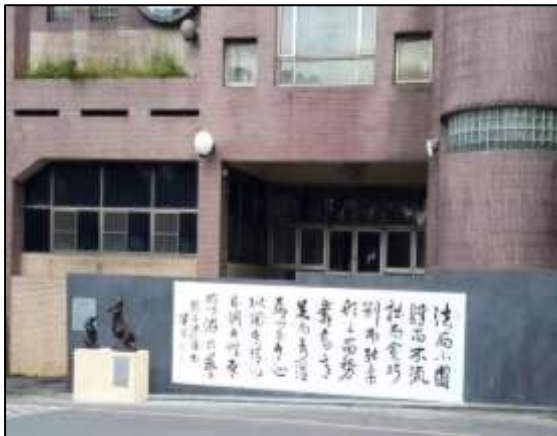
【人文藝術裝置「行草對話」】